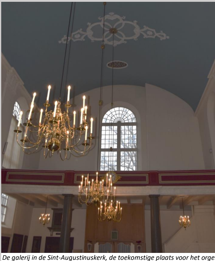
De galerij in de Sint-Augustinuskerk, de toekomstige plaats voor het orgel